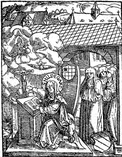
Abbildung 1: Jakob Köbel (1524), Hildegard von Bingen auf dem Rupertsberg (aus: Bain 2015: 26).

Alle verwendeten Abbildungen und Tabellen werden mit einer Bildunterschrift versehen. Diese werden in 10 pt Schriftgrösse gesetzt. Die Abbildungen werden gemäss ihrem Erscheinen in der Arbeit durchnummeriert und entsprechend mit „Abbildung 1“ etc. betitelt. In der Bildunterschrift sind eine kurze Betitelung des Bildes sowie eine Information zur Herkunft des Bildes vorzunehmen. Dies kann gegebenenfalls ein Quellenverweis sein. Der Quellenverweis erfolgt in Kurzform oder mittels Fussnote.